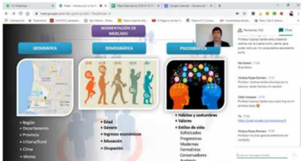
Foto 4: Capacitación Virtual Planes de Negocios y Mercado.